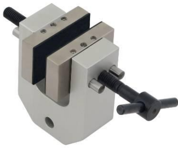
TH240k Kleiner Schraubspannkopf