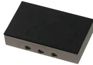
TH240k-BG Backen Gummibeschichtete Backen